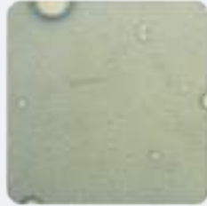
기본 수용성 절삭유 5%